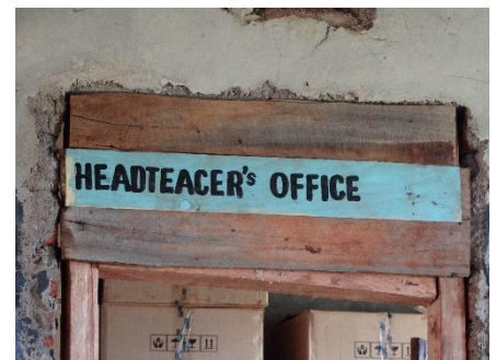
Kantoor van het hoofd der school. Maar wel een foutje in de spelling:-)