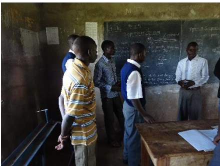
rondtoer op school